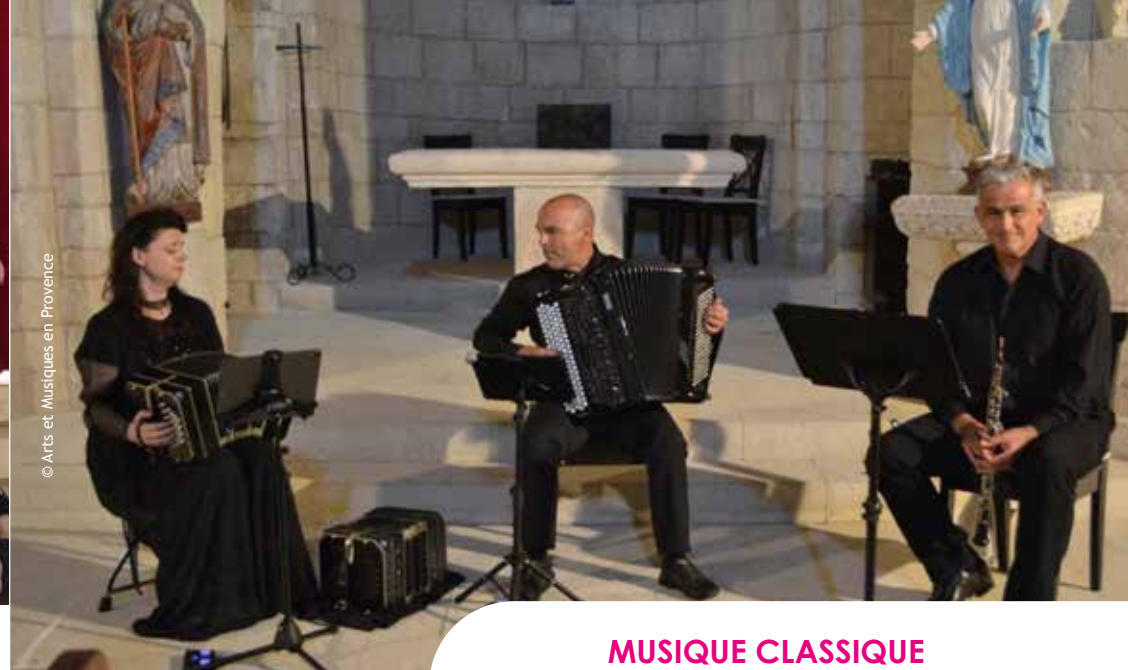
© Arts et Musiques en Provence