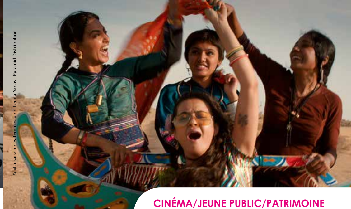
© «La saison des femmes» de Leena Yadav - Pyramid Distribution