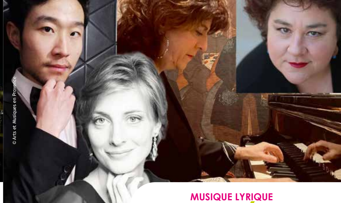
© Arts et Musiques en Provence