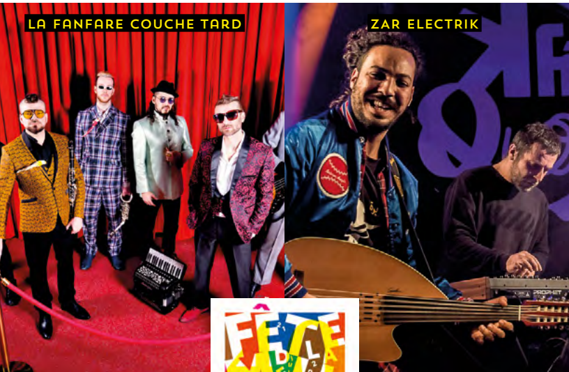
LA FANFARE COUCHE TARD