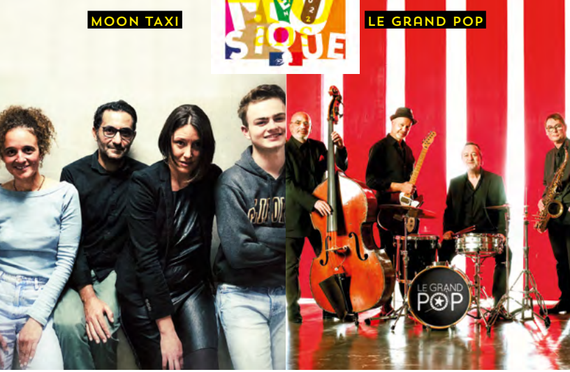
LE GRAND POP